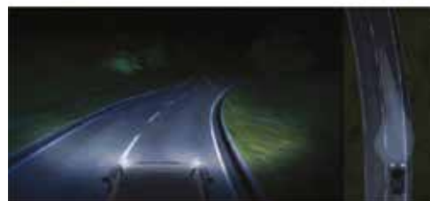
Dinamikus kanyarkövető fényszóró egy balkanyarban (felül) és egy jobbanyarban (alul)