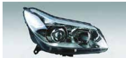
A Citroën C5 xenon DBL fényszórója

A modern rendszerekben ezek az elemek egy CAN-buszon vagy más jeladó-buszon keresztül kommunikálnak egymással.