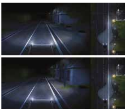
Tompított fényű fényszóró a városban (felül), javult látási viszonyok városi fénykévével (alul)

A Valeo teljesen adaptív fényszóró-rendszere (Full Adaptive Frontlighting System) egy háromfunkciós modulon alapul, amely háromféle eltérő fénykéve (tompított fényű, országúti és autópálya-fénykéve) létrehozására képes. Ennek a világítómodulnak a vízszintes irányítómechanizmussal és a szintbeállító eszközzel együtt történő használata révén a fényszórók további világítási funkciók biztosítására is képesek: városi világítás, kedvezőtlen időjárási üzemmód és országúti világítás.