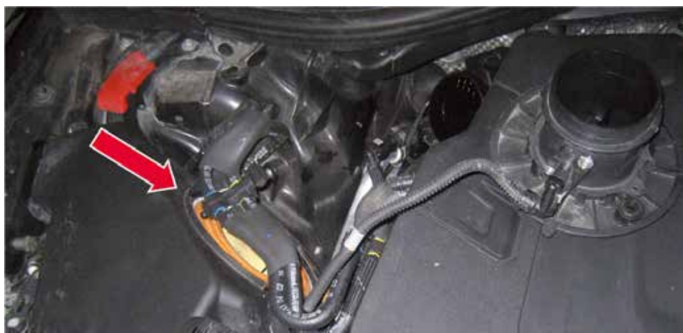
❶ A légszűrő elhelyezkedése a V6 TDI motortérben.

A légszűrő ❶ helytelen beszerelése miatt előfordulhat, hogy zavaró szívási hang jelenik meg, a hibatárolóban pedig a légtömegmérőre vonatkozó hiba található. A leggyakrabban elkövetett hiba a szűrő nem megfelelő szögben történő beszerelése ❷. Az Audi 2.8 FSI, a 3.0 TDI, a 3.0 TFSI és a 4.0 TFSI motoroknál fordulhat elő ez a szerelési hiba, ami miatt a szűrőbetét excentrikusan helyezkedik el a házhoz képest. Ennek hatására turbulencia jön létre a levegő beszívása során, ami megzavarhatja a légtömegmérőt, így kerül be a hibakód a tárolóba. (Nincs diagnoszta, akinek ez a hibakeresés során eszébe jutna...). Nagyobb mértékű excentricitás hatására pedig