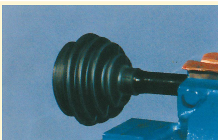
1. A porvédő gumi felhelyezése a tengelyre