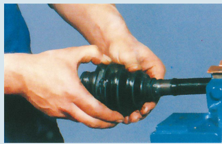
5. A gumiharmonika eltávolítása