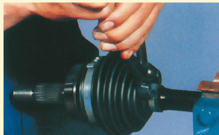
10. A bilincset célszerszámmal megfeszítjük és rögzítjük.