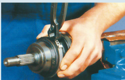
1. A bilincs eltávolítása