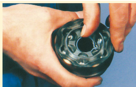
2. A biztosítógyűrűt helyezzük a horonyba, ha nem sérült; ha az, akkor cseréljük!