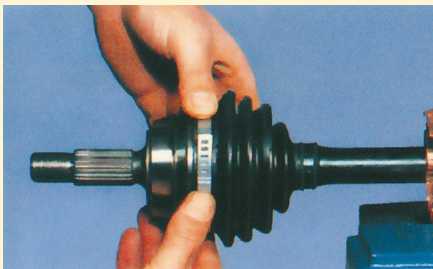
9. A rögzítő bilincset a megfelelő horonyba kell beakasztani – az erre a célra kifejlesztett bilincset (nem AWAB!).