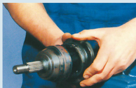
2. Porvédő gumi lehúzása