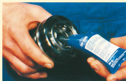
5. A csukló kenőanyaggal való feltöltése – csak az erre a célra szolgáló kenőanyaggal és a megadott mennyiséggel