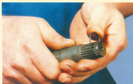
3. A belső biztosítógyűrűt helyezzük fel a tengelyre, ha nem sérült; ha az, akkor cseréljük!