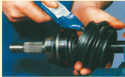
7. A porvédőbe a maradék zsírt benyomjuk, ügyelve, hogy a porvédő gumi rögzítő felületére ne kerüljön zsír.