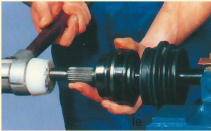
6. A csuklót addig ütjük a gumikalapáccsal, amíg a biztosítógyűrű a megfelelő pozícióba el nem éri, ellenőrizzük a rögzített pozíciót (ne legyen elmozdítható).