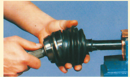
8. A porvédőt felhúzzuk a csuklóra.