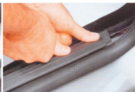
A Velcro-t és a szőnyeget óvatosan össze kell nyomni