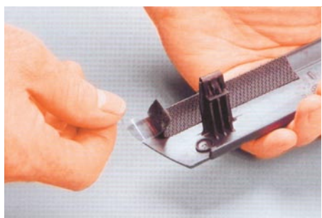
A védőfólia eltávolítva