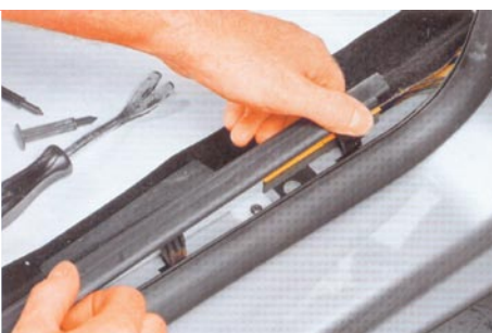
A küszöbburkolat a helyére kerül