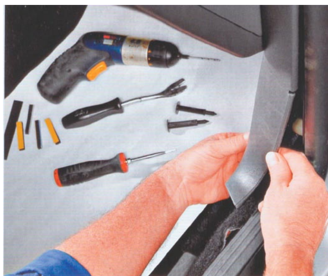
Az oldalburkolat eltávolítva. A padlón látható néhány eszköz, ami a javításhoz szükséges

A habdarabok helyének megtisztítása után csak a két elem egy sarkánál távolítsuk el a fóliát és a két habdarabot a szőnyegvezető végéhez ragasszuk (lásd a képet). Ezután távolítsuk el az egyik éppen felragasztott habdarabról a felső fóliát (a másodikról nem szabad leszedni a szükségesnél hamarabb, így elkerülhető a kosz és a por beleragadása a felületbe). A harmadik darabról is vegyük le a fóliát az egyik oldaláról, és nagyon óvatosan ragasszuk fel az első darab tetejére. Ezután jön a negyedik habdarab, a fóliákat eltávolítva, a korábbi alapos munkát megismételve, ragasszuk fel a helyére.