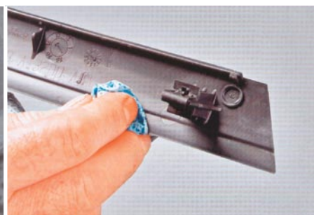
Szilikoneltávolítót a burkolat megtisztításához, ahova a Velcro felragasztásra kerül