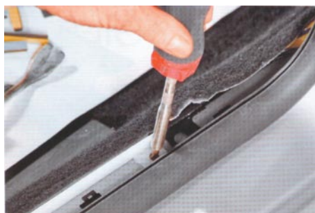
Az önmetsző csavar és az alátét beszerelve