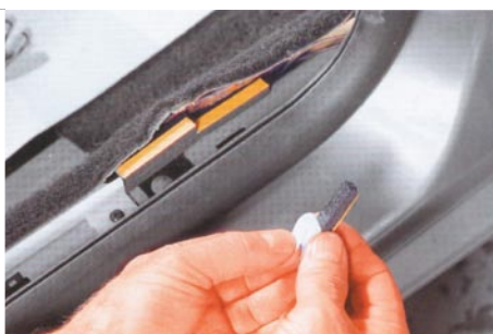
A négyből három habdarab már a helyén van