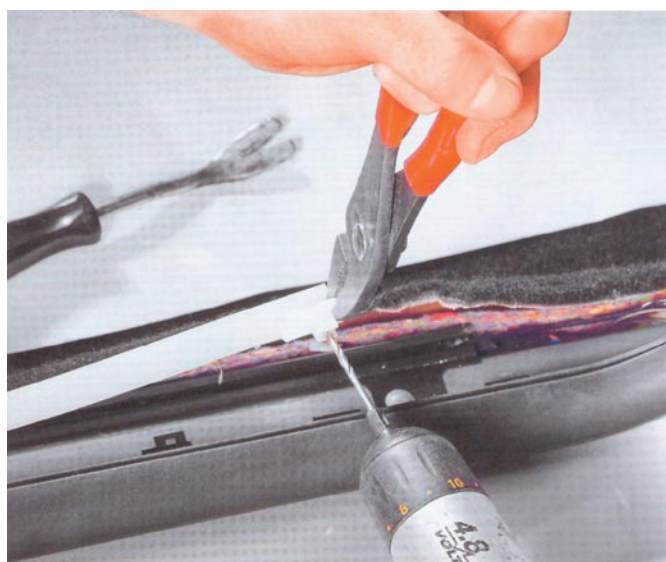
Egy 3 mm-es furatot fúr