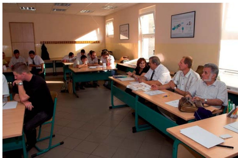
A szakmatörténeti vetélkedő résztvevői és a zsűri

Az élő zenés-táncos mulatságba torkoló programot az iskola partnerei közül