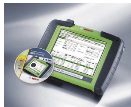
KTS 340: Kompakt, teljeskörű, hordozható – a Bosch új testere