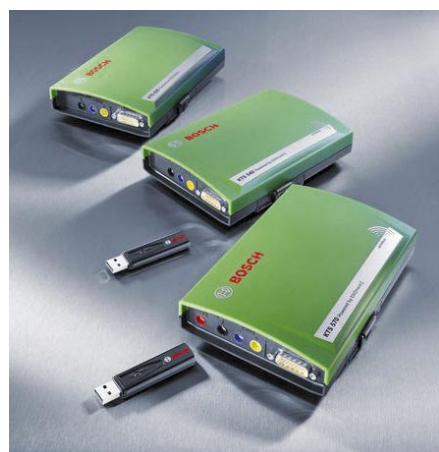
KTS 530/540/570: diagnosztikai modulok: Euro 5 kompatibilitással

A SAE J2534 egy interfész szabvány, melyet a SAE (Society of Automotive Engineers – USA autópári mérnökök szervezete) fejlesztett ki és amelyet az US EPA (Environmental Protection Agency – USA környezetvédelmi hivatala) elfogadott a jármű-vezérlőegységek újraprogramozásához. A cél az volt, hogy egy olyan programozási interfész készülhessen, melyet minden járműgyártó elfogad, lehetővé téve a független autójavító szakma számára azt a lehetőséget, hogy a jármű-vezérlőegységek újraprogramozását speciális gyártói célszám nélkül is elvégezhessék.