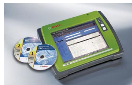
KTS 670: jól áttekinthetően és egyértelműen a teljeskörű vezérlőegység-diagnosztikához