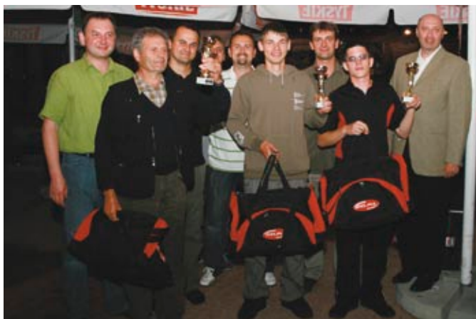
A tanuló versenyének győztes csapata