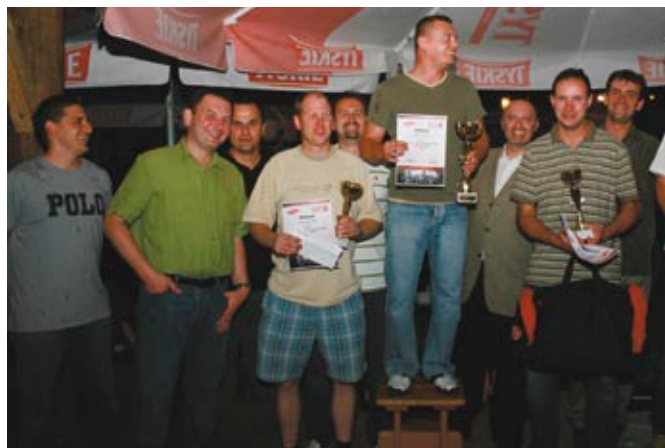
Az autószerelő versenyének első három helyezette