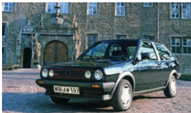
Polo G40 a wolfsburgi kastély előtt

A fotózás után az autók a Volkswagen-múzeumhoz gördültek, ahol estig megtekinthették őket az érdeklődők. A kiállításhoz a múzeum