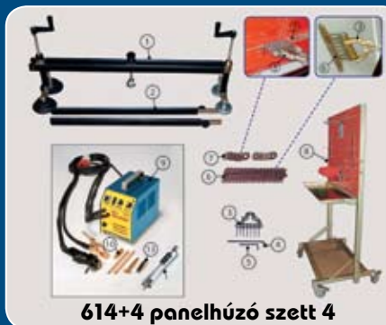
614+4 panelhúzó szett 4