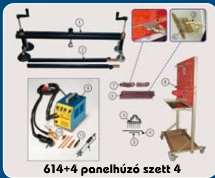
614+4 panelhúzó szett 4