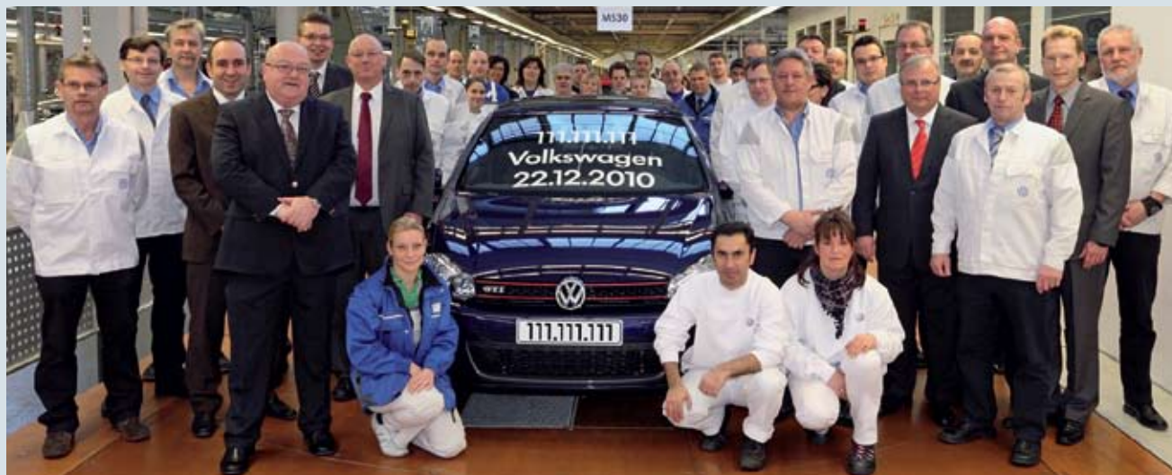
Ok az ünneplésre: Néhány hete egy Golf VI GTI gördült le 111 111 111. Volkswagenként a wolfsburgi gyárból.