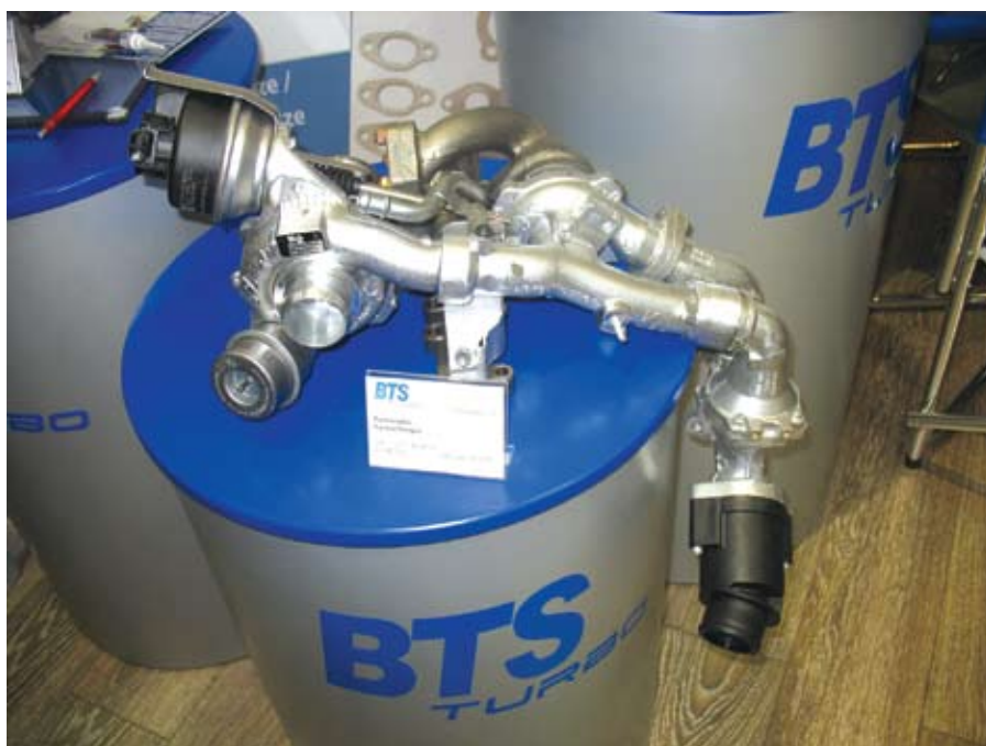
A turbókinálat széles palettáját mutatta be a BTS, mely Magyarországon is forgalmazza számos turbófeltöltőgyártó utópiacra szánt, csővezetékekkel is kiegészített töltőit. Képünk a VW T5/Amarok 2.0 BiTDI motor turbófeltöltőjét mutatja

Az AutoZum kiállításon – ez a gyakorlat – az aftermarketre szállító nagy alkatrészgyártók önálló standdal, néhány jelentős cég kivételével (például TRW,