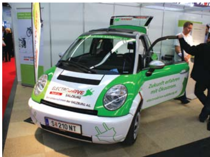
A salzburgi villanyautó imponáló műszaki adatokkal bír, például hatótávolsága európai tesztciklusban mérve 160 km. Havi bérleti díja most csak 360 €