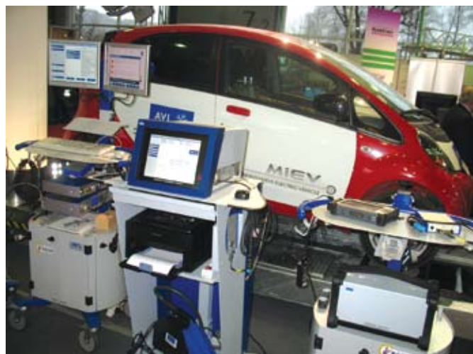
Az AVL műszerek gazdag kínálata mögött az elektromos autó mint a diagnosztika tárgya jelent meg, illetve próbautakra invitáltak vele az érdeklődőket

ti irányt vesszük, Angliától Ukrajnáig, ez utóbbi országban komplett vizsgasorokkal is.