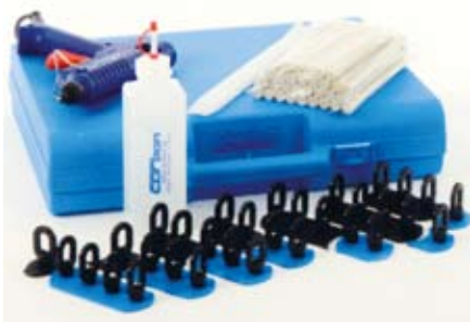
3. ábra: a kihúzatáshoz alkalmazható ragasztókészlet

kalmazható. Az alumínium kocsiszekrényeknél a konstruktőrök gyakran alkalmazzák a kettős falú építési módot, amely akadályozza a deformálódott külső lemezfelület helyreállítását. A deformáció helyreállításához itt is lehet alkalmazni a kihúzatófüleket pontszerű felhegesztését. Az alumínium hegeszthetőségi problémái ismertek – olvadási hőmérséklete nagyon alacsony, mindössze 658 °C –, amelyek kiküszöbölésére olyan hegesztőberendezést kell alkalmazni, amely biztosítja relatív kis idő alatt a nagy áramerősséget. A 2. ábrán egy Audi TT kerékjáratí dobjának javítását mutatjuk be.