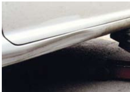
4. ábra: kihúzatás ragasztásos módszerrel

kalmazható. Az alumínium kocsiszekrényeknél a konstruktőrök gyakran alkalmazzák a kettős falú építési módot, amely akadályozza a deformálódott külső lemezfelület helyreállítását. A deformáció helyreállításához itt is lehet alkalmazni a kihúzatófüleket pontszerű felhegesztését. Az alumínium hegeszthetőségi problémái ismertek – olvadási hőmérséklete nagyon alacsony, mindössze 658 °C –, amelyek kiküszöbölésére olyan hegesztőberendezést kell alkalmazni, amely biztosítja relatív kis idő alatt a nagy áramerősséget. A 2. ábrán egy Audi TT kerékjáratí dobjának javítását mutatjuk be.