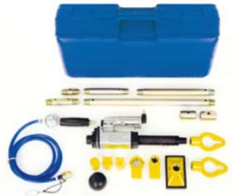
5. ábra: AiroPower nevű húzó- és nyomatókészlet

A Carbon cég Miracle készleteivel jelentősen meggyorsíthatjuk a karosszéria javítási munkálatokat. A ragasztásos technikával az időráfordítás megtakarítási értéke – a gyártó cég szerint – 90%-os, míg hegesztéses rend-