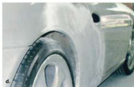
1. ábra: sérült kocsiszekrény egyengetése Miracle eszközökkel a – külső részre húzófülek felhegesztése, b – húzás kézi készülékkel, c – felső rész húzása, d – kijavított, kitelt felület