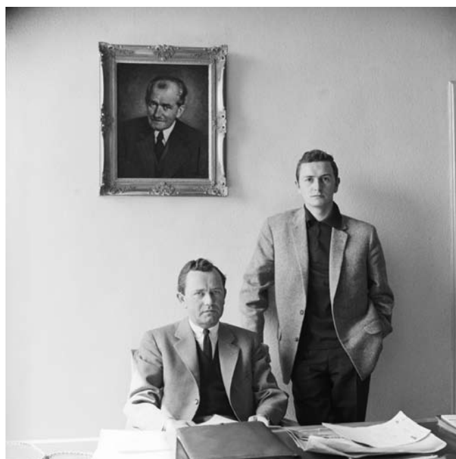
Ferdinand Alexander Porsche édesapja, Ferdinand Anton Ernst (ismertebb nevén Ferry) Porsche és nagyapja portréja, Ferdinand Porsche társaságában 1960 körül