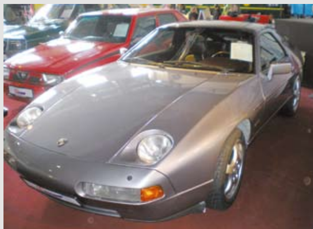
Porsche 928 (1988)