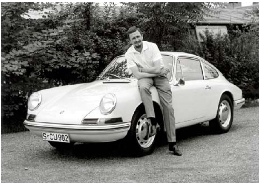
Ferdinand Alexander Porsche 1963-ban és az általa megalkotott Porsche Typ 901 (T8)

1958-ban belép az akkori Dr. Ing. h.c. F. Porsche KG tervezőirodájába. Formalkotói táalentumát hamar megmutatta, amikor elkészítette a 356-os utódmodelljét plasztilinból. 1962-ben átveszi a „Porsche-Designstudio” vezetését és egy évvel később gondoskodott a Porsche 901-es (illetve 911-es) világraszóló zajos sikeréről. Ferdinand Alexander Porsche a 911-essel egy sportautóikont alkotott meg, mely időtlen, ugyanakkor klasszikus formájával már a hetedik generációjába lépett. Személyautók mellett a '60-as