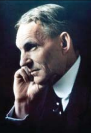
150 éve született Henry Ford

„A kudarc az egyetlen lehetőség arra, hogy még okosabban kezdjük újra.”