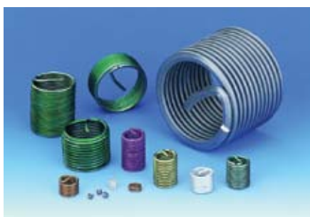
HELICOIL® plus menetbetétek