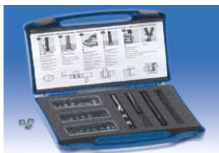
HELICOIL® plus menetjavító egységcsomagok (M2-M36)