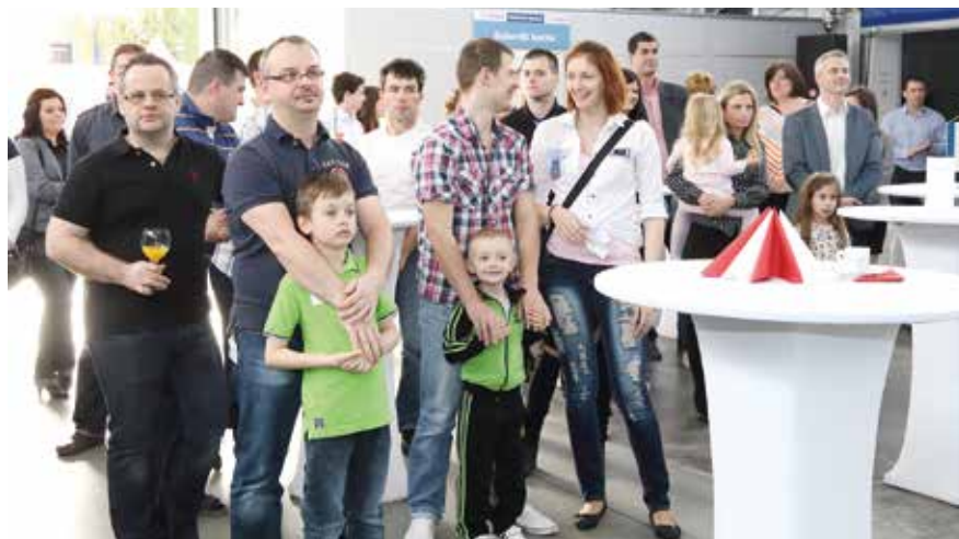
A cég dolgozói a vállalat fennállásának 10. évfordulójára családtagjaikkal érkeztek

A gyerekvetélkedők, ügyességi játékok, színjátások minden korosztálynak szolgáltak élménnyel és mindezt a vendéglátás pazar bősége, ínycsiklandó finomságai koronázták meg. Szerkesztőségünk nevében mi is köszöntjük a 10 éves Bosch Electronic Service Kft. munkatársait, további sikereket kívánunk munkájukhoz! Köszönjük, hogy betekintheztünk munkájuk részleteibe, megnézhattük a „szentélyekben” folyó munkát, és azt, hogy erről – mi más célja lehet egy szaklapnak – beszámolhatunk olvasóinknak. ■