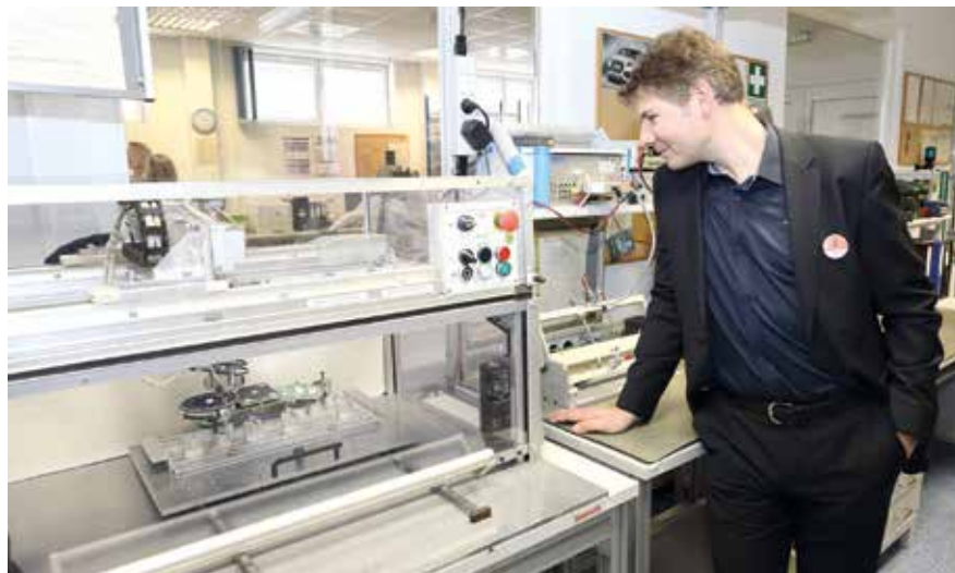
A műszerfalmutatót saját fejlesztésű robot szereli

Sok esetben nem könnyű az újragyártás. Számos alkatrész tervezésénél nem veszik azt figyelembe a konstruktőrök és gyártástechnológusok, hogy a belső egységek esetleges elromlása, elhasználódása után egyszerűvé tegyék a felújító munkát. Magyarul szólva ezek az alkatrészek tervezetten nem bonthatóak. A reman első feladata a hozzáférés megtervezése, technológiájának kidolgozása. A javítás befejeztével pedig a szakszerű visszazárás elvégzése. A legjobb gyártóknál is előfordul, hogy az