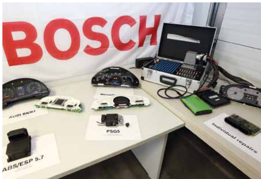
Mechatronikai alkatrészek, melyek elektronikáját újítják fel

Ez üzlet mindkét félnek! A gyártó tudását újrahajthatja, a vevő akár harmadával is olcsóbban jut kiváló alkatrészekhez, 24 hónap garanciával. További előny, hogy sok esetben