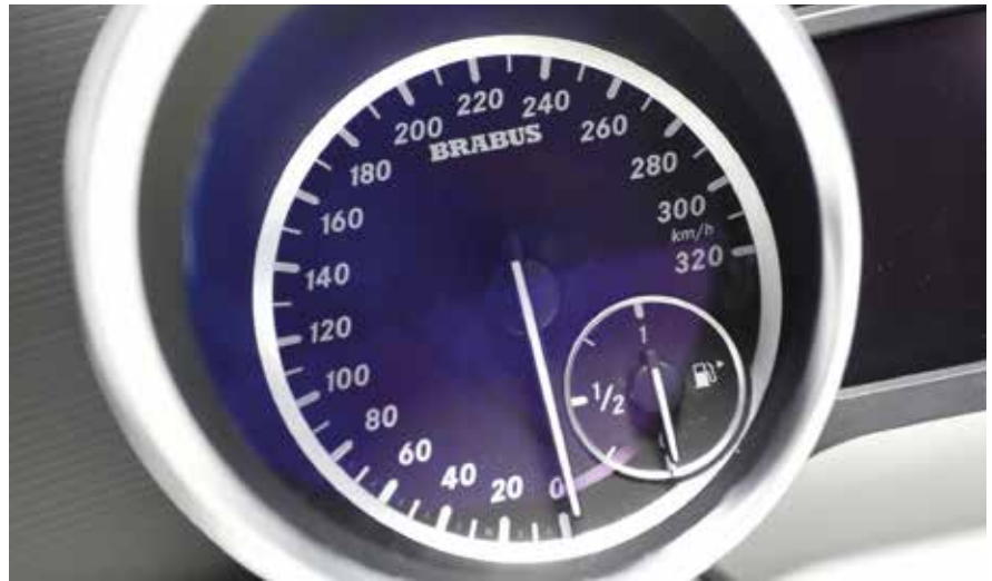
Gyártmányaik közül egy különlegesség: a Mercedes Brabus modell számára készült műszerfal sebességmérő órája

A Bosch mindig is úttörő volt. Számítatlan innovációval a kezdetektől élen jár a technológiai fejlődésben. De nem a technika fontos számunkra igazán, hanem az ember. A vásárlóink, a partnereink és leginkább a munkatársaink.”