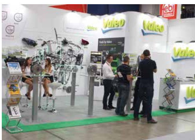
A Valeo-standon a gyári beszállítói termékek mellett a kifejezetten alkatrészpiacra szánt termékek is megjelentek. A 4P Kit a kéttömögű lendkerekek kiváltására szolgál. A hagyományoshoz képest nagyobb rugóúttal és csillapítással rendelkező kuplungtárcsa veszi át a kéttömögű lendkerék szerepét.