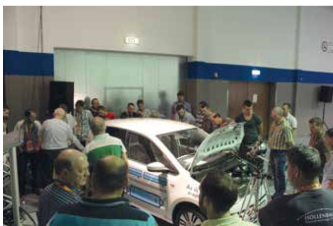
A tavalyi rendezvényhez hasonlóan a Fórum tér biztosította a helyszínt a szakmai előadásoknak.