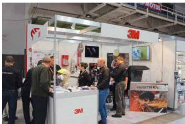
A 3M-nél a Cubitron termékcsoport dominált.