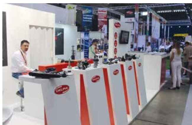
A Delphi szinte teljes termépalettáját kiállította: futóműalkatrészekkel, segédberendezésekkel és befecskendező rendszerekkel töltötte meg standját.