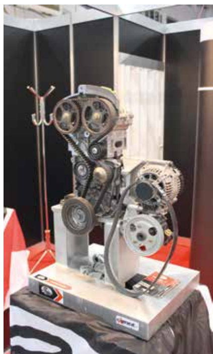
A Gates standján az Autótechnika magazinban már bemutatott Stretch Fit szíjak szerelését lehetett kipróbálni a cég célszerszámaival.

konzultációkra és workshopok élő szerelési bemutatóira, de egyes standokon játékos feladatokban és versenyeken is szórakozva összemérhették ügyességüket, tudásukat.